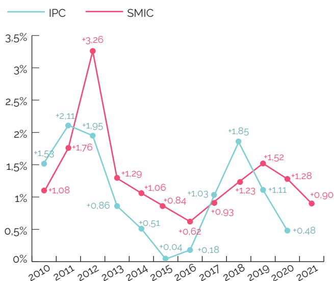
ÉVOLUTION EN % DU SMIC ET DE L'INDICE DES PRIX À LA CONSOMMATION (IPC) DEPUIS 2010

prix de certaines dépenses incompressibles ont poursuivi leur hausse en 2020, comme l'alimentation dont l'indice a augmenté de 2,1% en 2019 et de 1,24% en 2020.